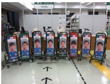
ラッピングブックトラック