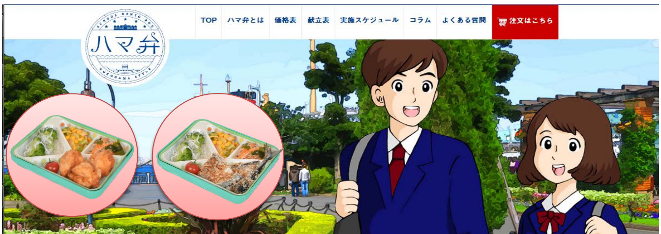
※写真は「ハマ弁ホームページ」のトップページと、ハマ弁（おかず）の写真です。