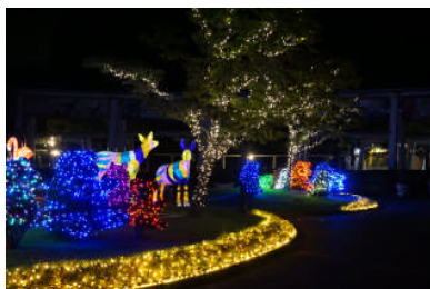
▲写真はイメージです