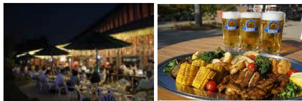
▲写真はイメージです