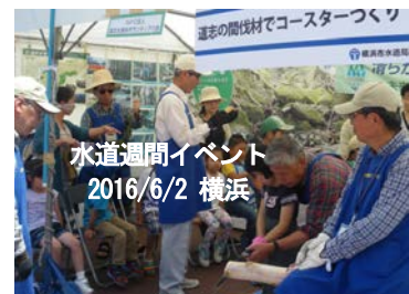
水道週間イベント 2016/6/2 横浜