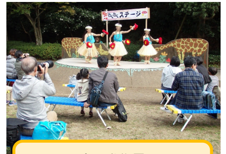
金沢動物園 【動物園の文化祭】