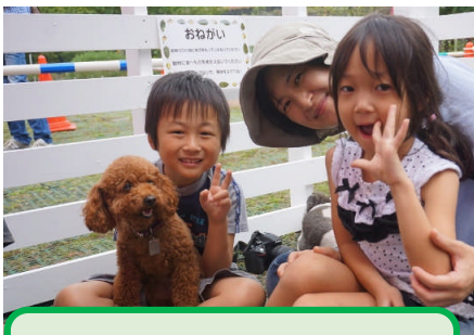
よこはま動物園ズーラシア 【わんにゃん大集合】

よこはまのどうぶつえんでは、秋の動物園を満喫する様々なイベントを行います。 各園のイベント情報は裏面をご覧ください。