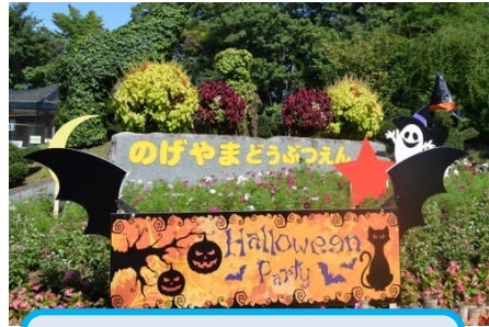
野毛山動物園 【ハロウィン装飾】