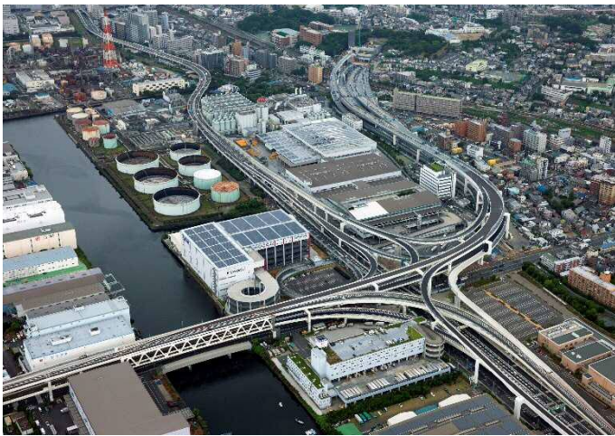
① 生麦ジャンクション