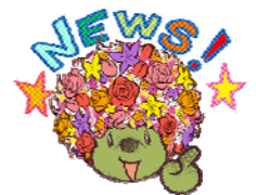
LINE スタンプ例

テーマソングの決定を受け、24日（土）のトークショーで、PR アドバイザーである小松成美様から、GReeeeN の皆様のテーマソングにかける思いなどをお話しいたします。