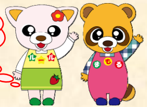
交通安全キャラクター ルールちゃんとももるくん