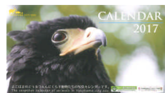
オリジナルカレンダー表紙