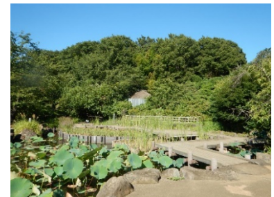
馬場花木園内（池越しに見る東屋）

【歴史を生かしたまちづくり要綱に基づく歴史的建造物の認定年月日】平成4年1月31日