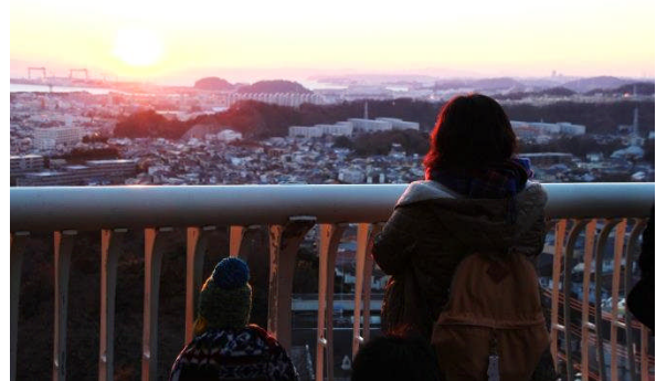
平成 28 年 1 月 1 日の様子