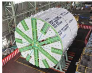
シールドマシン（仮組）

見学場所を上空から撮影した写真です。写真の中央にある四角い縦穴が発進立坑です。現場に設置した巨大なクレーンを使い、分割されたシールドマシンを発進立坑内に運び込み、組立てを行っています。