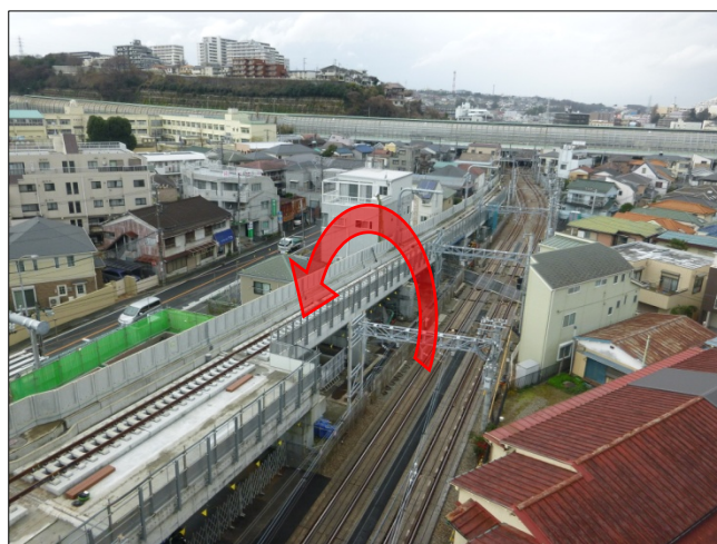
写真2。現在の下り線から高架橋上への切替（星川4号踏切付近）