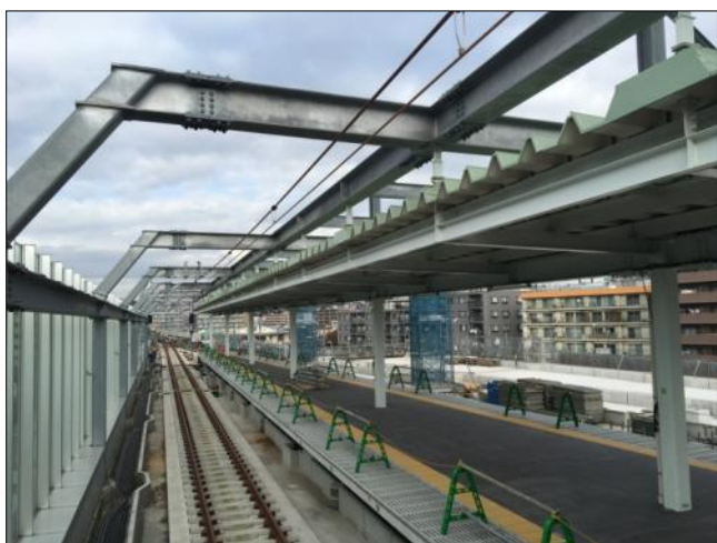
写真1。星川駅の新しい下りホーム