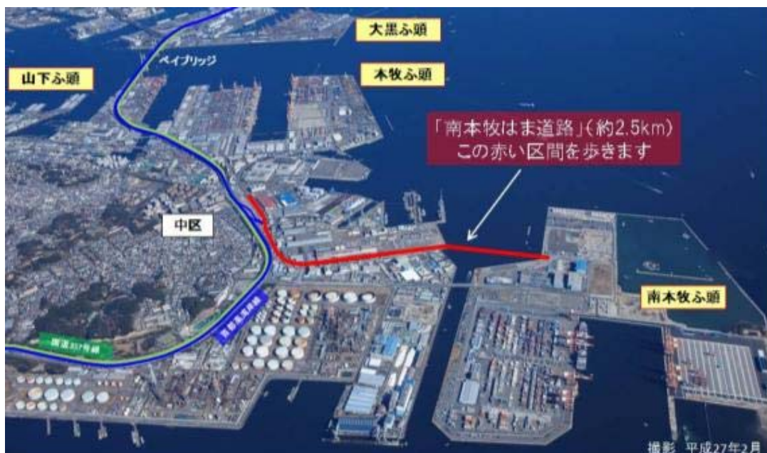
図-1 ウォーキング場所

※ウォーキングイベントの取材をご希望される報道関係者の方は、(別紙-4)取材要領をご確認のうえ、平成29年2月28日(火)18:00までに(別紙-5)取材申込書に必要事項をご記入いただき、FAXによりお申し込み下さい。