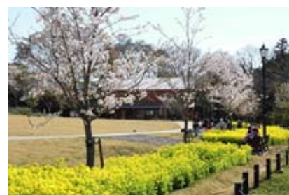
○外苑休憩棟と花壇