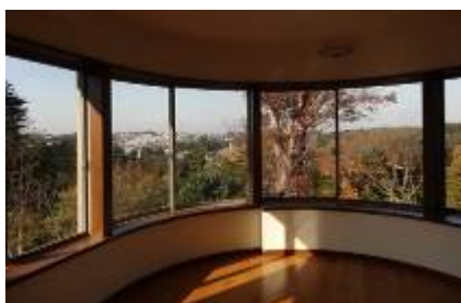
○俣野別邸 (2 階展示室)