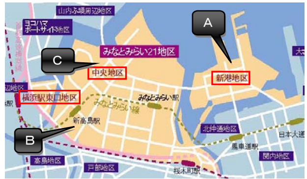
みなとみらい 21 地区の範囲及び新規オープン施設の位置

地区内の施設設置者を対象に行った、 平成 28 年 12 月時点における就業者数 及び事業所数の調査を基に算定