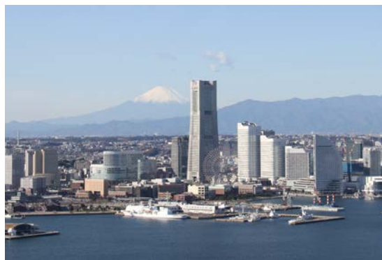
平成 28 年の来街者数、就業者数及び事業所数