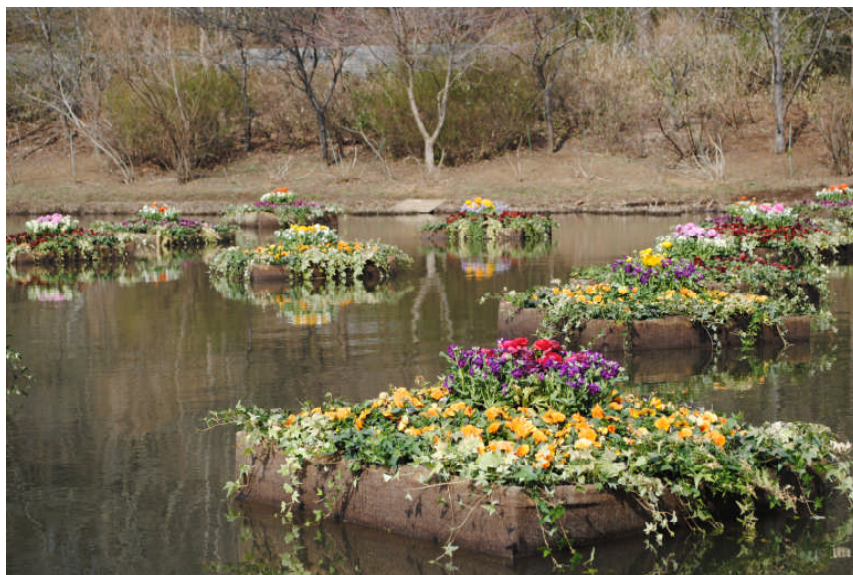
色とりどりの「花いかだ」(イメージ)