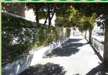
道路沿いのフェンスを緑化