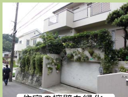
住宅の擁壁を緑化