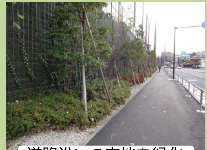
道路沿いの空地进行緑化