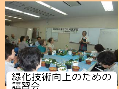
緑化技術向上のための講習会