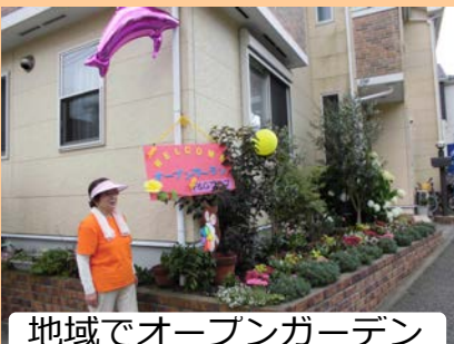
地域でオープンガーデン