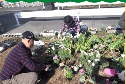
地域の皆さんで花苗の植替え