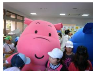
かばのだいちゃん