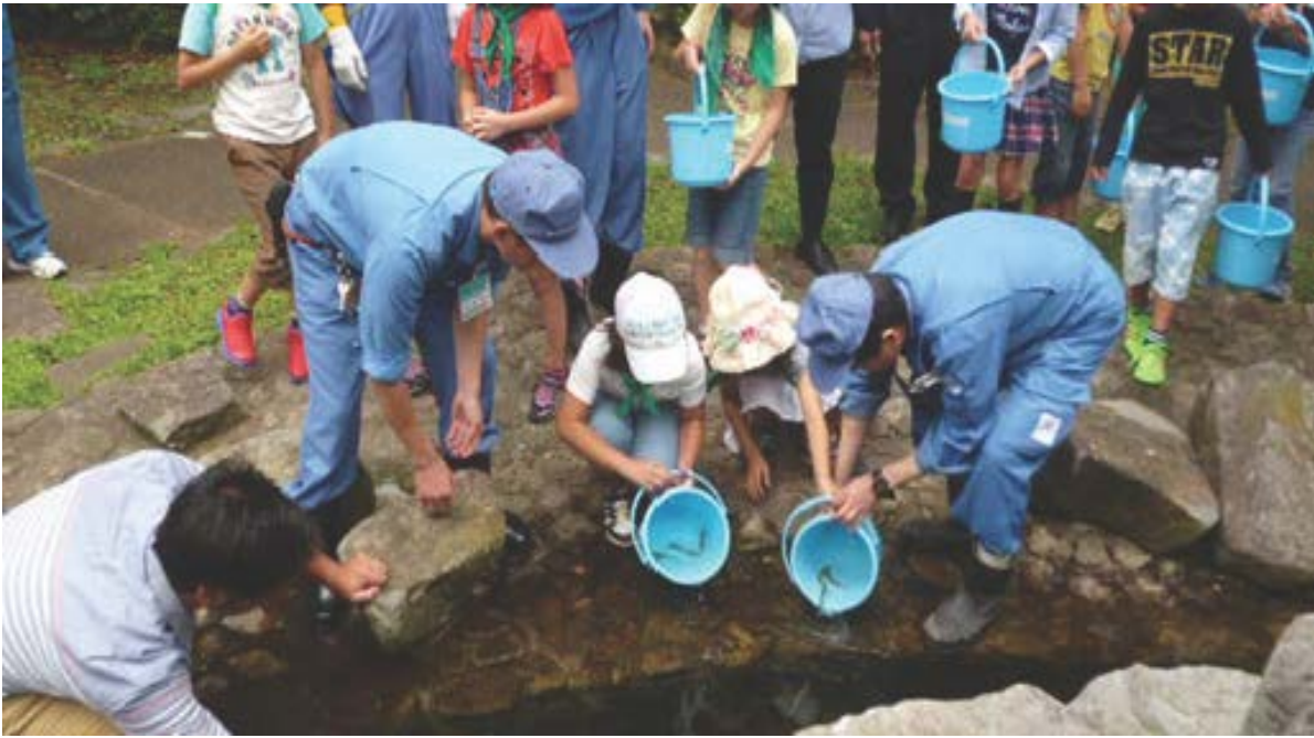
昨年のあゆ放流風景（横浜市立山元小学校の児童の皆さん）