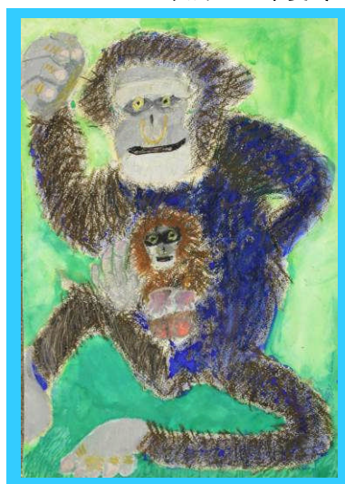
【小学生・幼児部門】