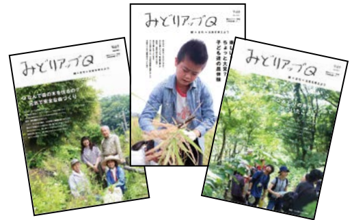
広報誌「みどりアップQ」の発行