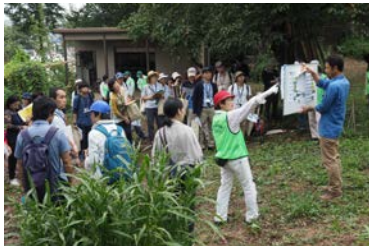
現地調査(愛護会の方からの説明)