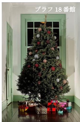
ブラフ 18 番館