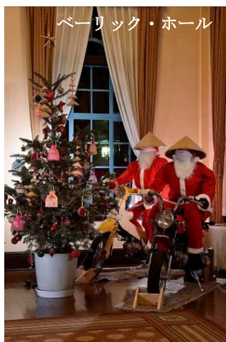
ベーリック・ホール