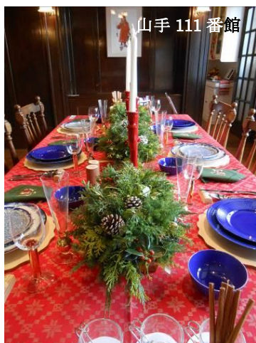
山手 111 番館