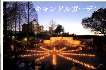
キャンドルガーデン