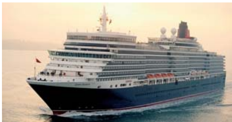
クイーン・エリザベス (90,900 総トン)

さらに、2019年4月には「クイーン・エリザベス」が初の横浜発着クルーズを2回実施するなど、横浜港は今後もますます多くの客船で賑わいます。