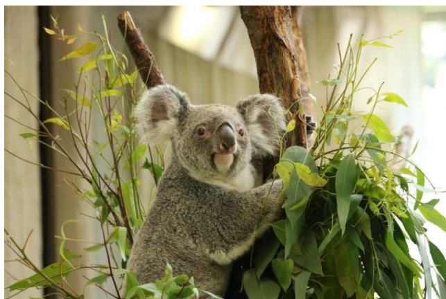
コアラもご覧いただけます