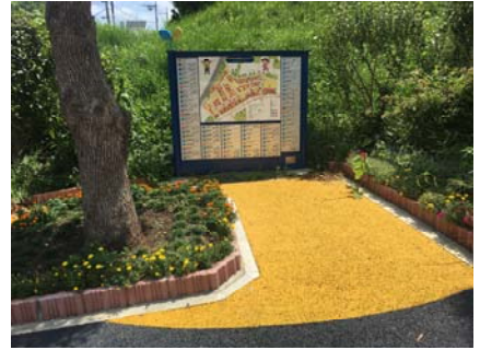
▲平成28年度整備施設（左から、わかみずの森（泉区）／もりのお茶の間（金沢区）／エリアマップ（都筑区））

1 開催日時 平成30年2月17日（土） 14時00分から17時15分まで（予定）