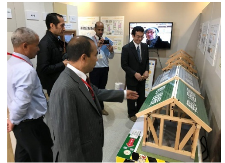
「スマートウェルネス 体感パビリオン」視察