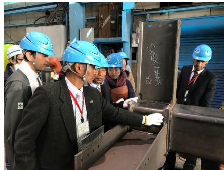
市内鉄骨工場の視察