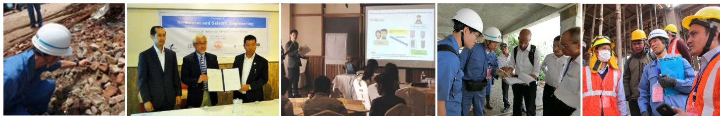
第 1 次派遣 (H27. 7)

平成 28 年 3 月、平成 29 年 3 月にはカトマンズ市職員を横浜に招くとともに、平成 28 年 6 月、10 月、平成 29 年 7 月、11 月には横浜市職員を現地に派遣し、建築指導行政（建築基準法、違反建築物対策等）や建築工事における品質管理等について研修を実施しています。