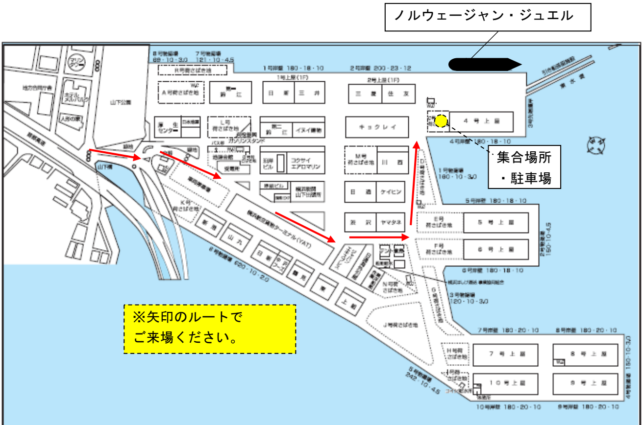
【図B：山下ふ頭案内図】