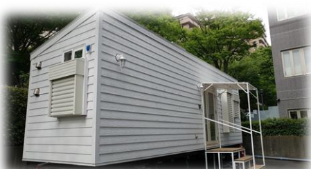
実験実証を行うIoTスマートホーム