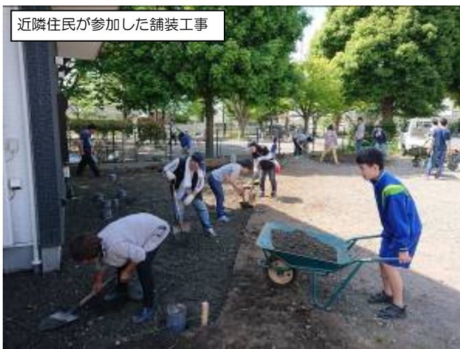
近隣住民が参加した舗装工事