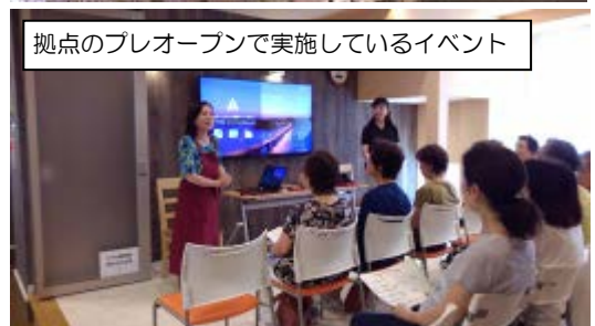
拠点のプレオープンで実施しているイベント