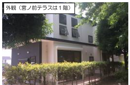
外観（宮ノ前テラスは1階）

高齢者向けの事業の一部は、「横浜市の介護予防・日常生活支援総合事業」として実施する予定です。