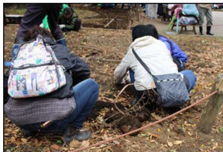
こんにゃく芋掘り体験