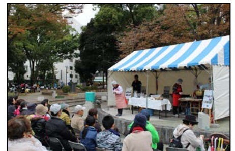
こんにゃく作り見学