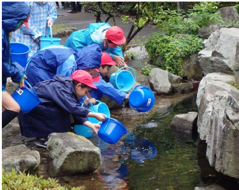
昨年のあゆ放流風景（横浜市立本牧小学校の児童の皆さん）

※下水道事業や環境について深い愛着や関心を持ち、横浜市下水道事業のサポーターとして、環境創造局と協働で下水道施設の案内ガイドや環境教育を行っているグループ