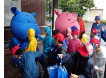
かぼのだいちゃんがお出迎え (水環境事業のキャラクター)