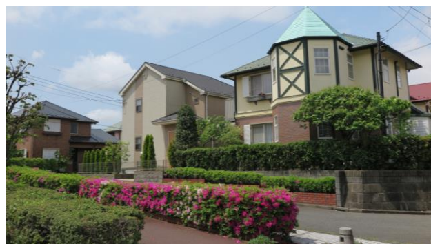
領家地区の街並み