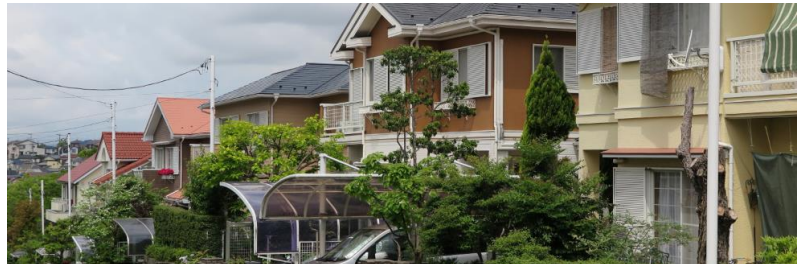
領家地区の街並み