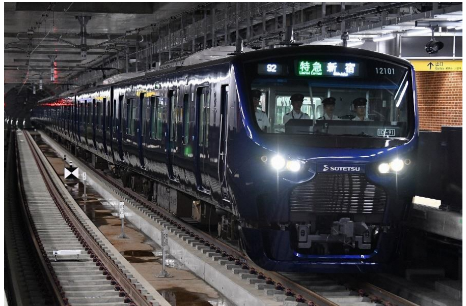
相鉄・JR直通線用の新型車両「12000系」