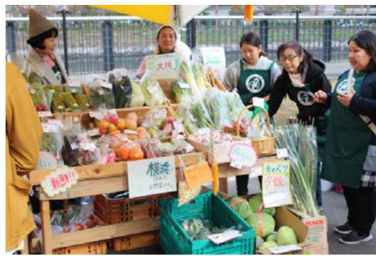
平成 30 年度の視察研修会の様子