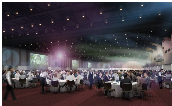
国内最大規模の多目的ホール