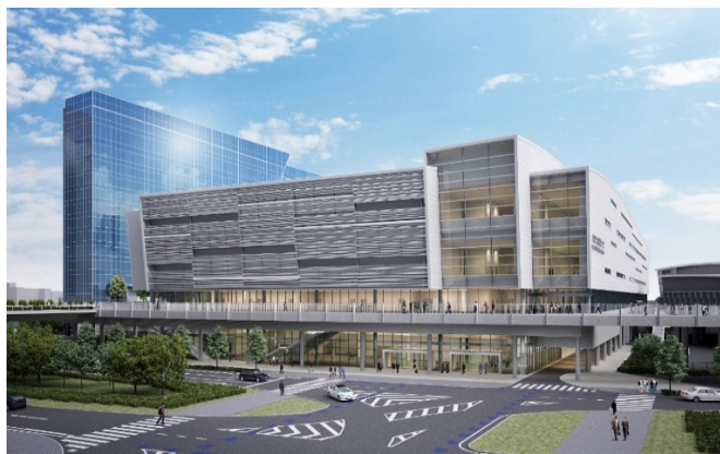
国際大通りから見たパシフィコ横浜ノース（手前）