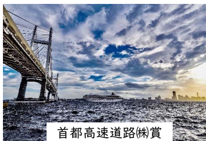
首都高速道路(株)賞