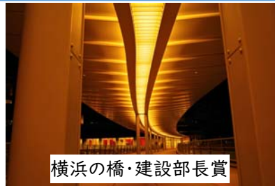
横浜の橋・建設部長賞