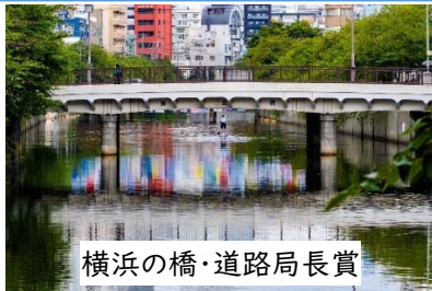
横浜の橋・道路局長賞