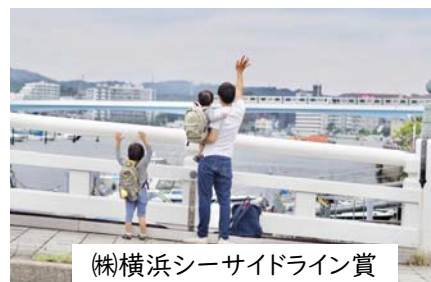
(株)横浜シーサイドライン賞