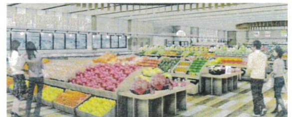
↑新鮮な野菜を市内のスーパーに安定供給