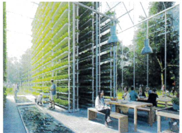
↑「オランダ式大規模農業」