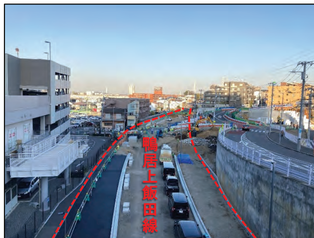
駅前から本宿町方向を望む (令和5年2月撮影)