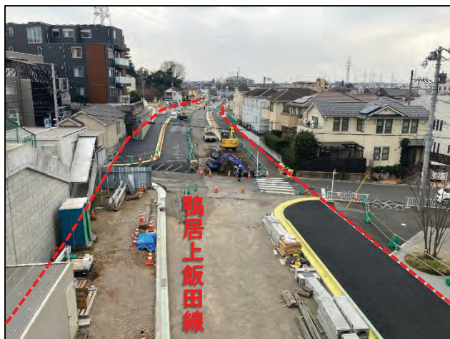
駅前からさちが丘方向を望む (令和5年2月撮影)